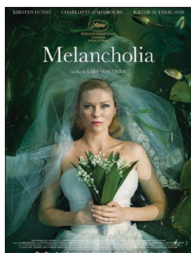
Melancholia (Lars von Trier, 2011)

może podjąć pracy zgodnej z wykształceniem. Podejmowane przez nią prace nie satysfakcjonują jej. Beata ma coraz większe trudności z funkcjonowaniem. Zaczyna mieć pierwsze objawy depresji. Przeludnione mieszkanie nie poprawia jej stanu. Nie może także liczyć na pomoc męża. Beata w pewnym momencie nie jest w stanie nic już robić. Utrzymaniem jej higieny zajmuje się teściowa, która sama jest przytłoczona całą sytuacją. Również i w tym przypadku mamy do czynienia z wyuczoną bezradnością. Wystąpiła depresja ciężka. Beata przejawia wyraźne cierpienie, które przekształca się w zahamowanie. Ciężki epizod depresji uniemożliwia wykonanie jakiegokolwiek pracy.