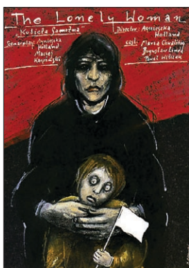
Kobieta samotna (Agnieszka Holland, 1981)

także postawa Almy, która przechodzi od zachwytu osobą Elżbiety do nienawiści. Elżbieta ją zniszczyła jednocześnie upodabniając ją do siebie. Alma po „terapeutycznym” wyjeździe sama nie jest w stanie nic mówić. Jeżeli chodzi o analizę Elżbiety prawdopodobnie cierpiała na zaburzenia dysocjacyjne (konwersyjne). Tego typu zaburzenie może pojawić się gdy nieprzyjemne uczucie spowodowane konfliktami czy problemami, których jednostka nie jest w stanie rozwiązać. Problem jest przekształcany w objaw. Początek i ustąpienie wyżej wymienionych stanów dysocjacyjnych są opisywane jako nagłe. Jednakże rzadko obserwuje się taką sytuację, jedynie podczas takich zabiegów jak hipnoza czy odreagowanie psychoterapeutyczne może nastąpić czasowe zniesienie takich stanów. Stany dysocjacyjne mają tendencję do ustępowania po kilku tygodniach lub miesiącach. Zwłaszcza jeśli początek zaburzeń był związany z urazowym wydarzeniem życiowym.